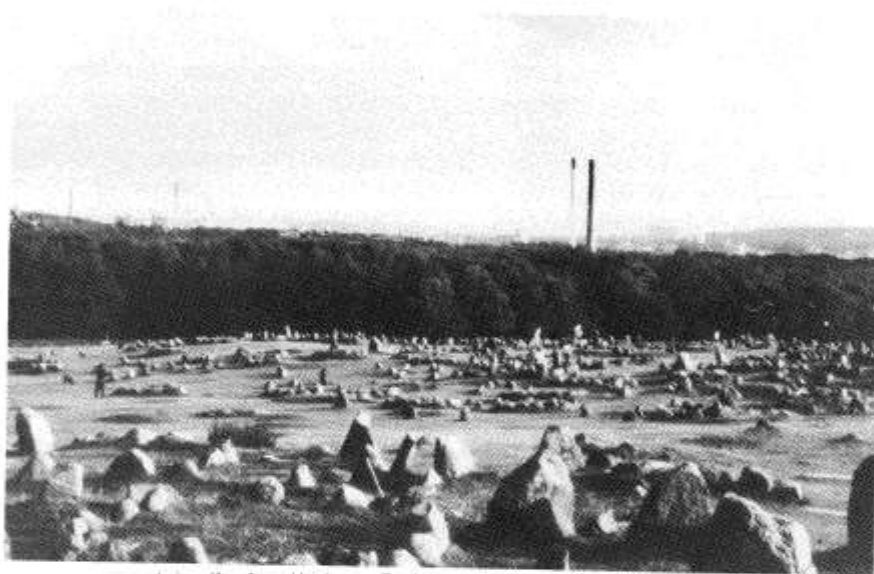
Lindholm Høje.

På kyrkogården står en minnessten över ortens store son, Jens Peter Jacobsen, mest känd som författare till romanen om den sökande diktaren Niels Lyhne.