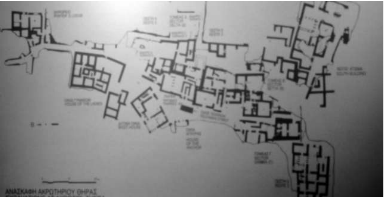
Karta över utgrävningen i Akrotiri.

Husens fönster är vanligen små nedtill, där man hade kök, eldstad, förråd och arbetsrum, och i viss