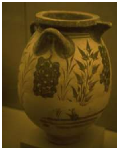
Kruka med vindruvsmotiv.