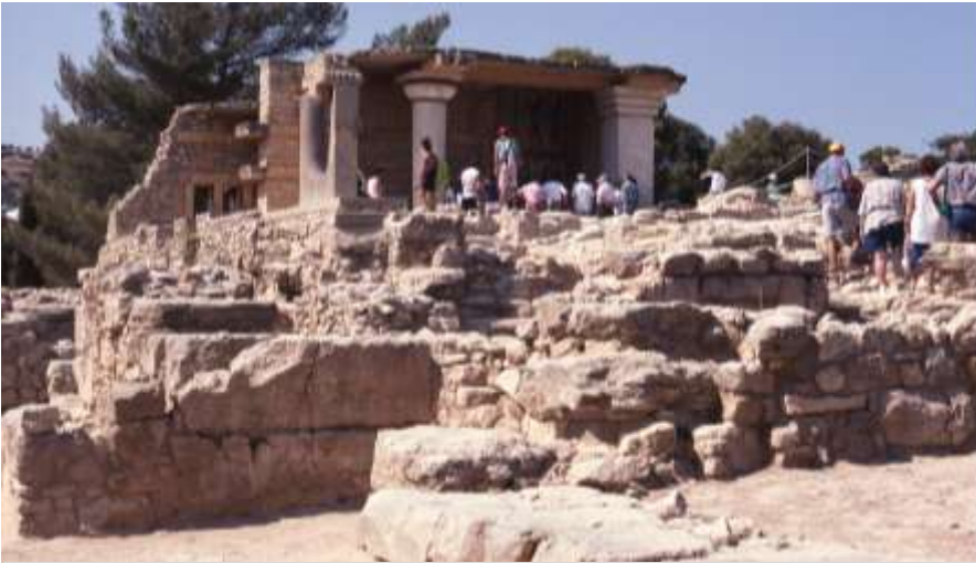
Palatsbyggnad, delvis rekonstruerad, Knossos.

bara bröst, en för övrigt heltäckande klänning. I sina höjda armar och händer håller hon två slingrande ormar. Dessa är knutna till jordens och underjordens gudaväsen. Ormgudinnorna tillverkades ca år 1600 f.Kr.