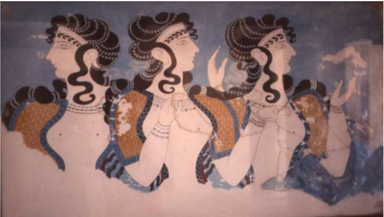
Damer i blått.