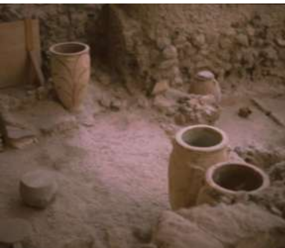
Hus med pithoi-krukor.