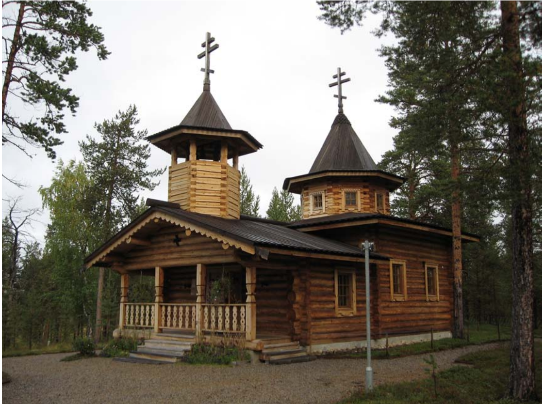
Njeä'1'lem Grekisk-ortodoxa kyrka.

ovanpå kan det finnas en mindre modell av en kista. Ett problem med språket i Njeä'1'lem är "blandfamiljerna" där föräldrarna talar olika språk dvs. skolt-, enaresamiska eller finska och då blir familjespråket oftast finska. Skoltsamerna skulle också behöva ett "språknäste" och vissa planer finns för ett i A'vvel.