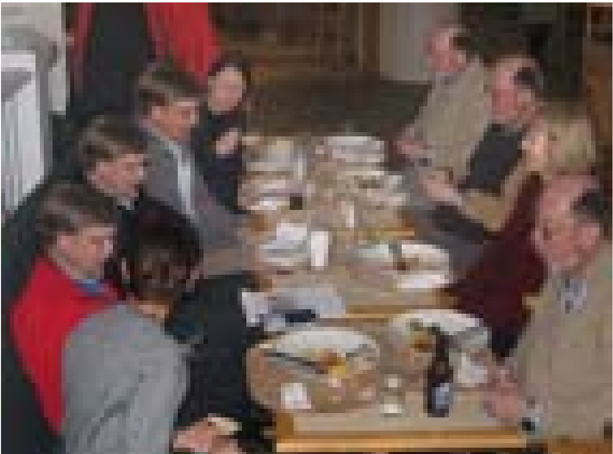
Ordföranden har ordet.