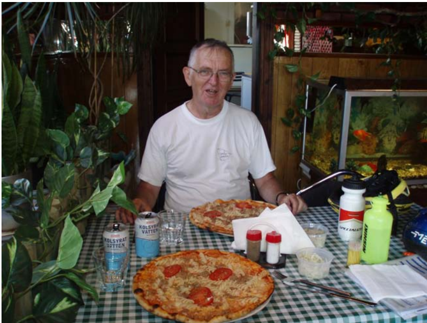
Pizza. Foto: Anders Schaerström. Personen på bilden har givetvis inget med texten att göra