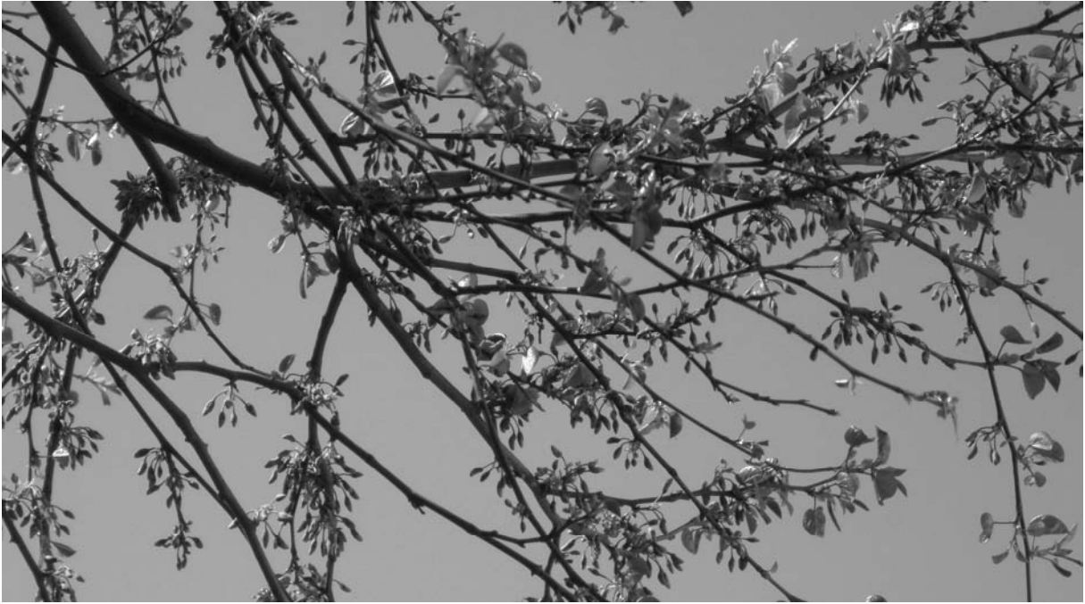
Det blommande judasträdet.