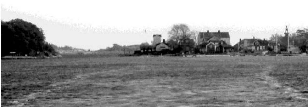
Skärgården, biotop för korsspindlar. En bild på det sk "Sandhamnshålet" den kända profilen, dvs den smala passagen där båtarna åker förbi det gamla tullhuset och lotsstationen med fyren.