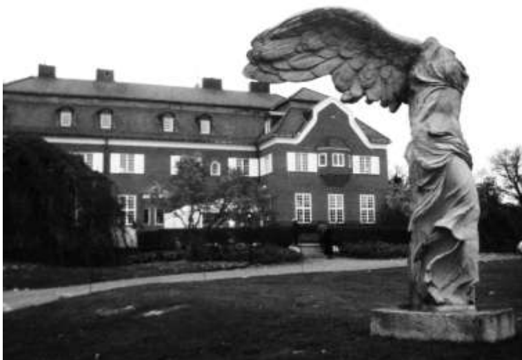
Kopia av Nike av Samothraki framför Villa Pauli

En lärorik, trevlig och nyttig vandringsdag tackar vi Erik för!