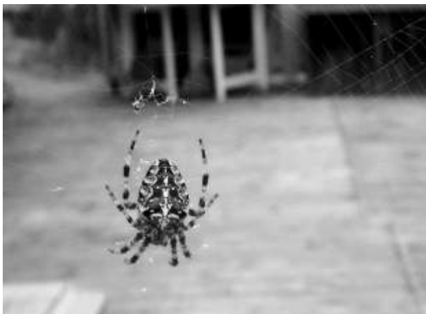
Storvuxen hona på senhösten.

Apropå vår artikelserie "Rysshärjningar i Stockholms skärgård" så kommer jag också att tänka på en annan varelse, som länge härjat och fortfarande trivs på många av de 30 000 öarna i Stockholms skärgård, nämligen den spindelart som denna gång pryder tidningens framsida, kors-spindeln ( Araneus diadematus ).