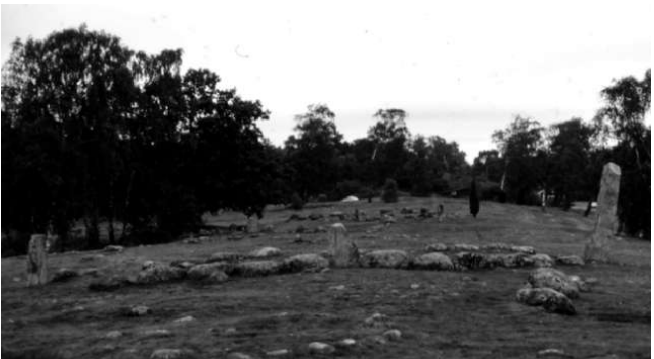
Gravfältet i Hjortahammar

Artikeln fortsätter i nästa nummer av NOS.