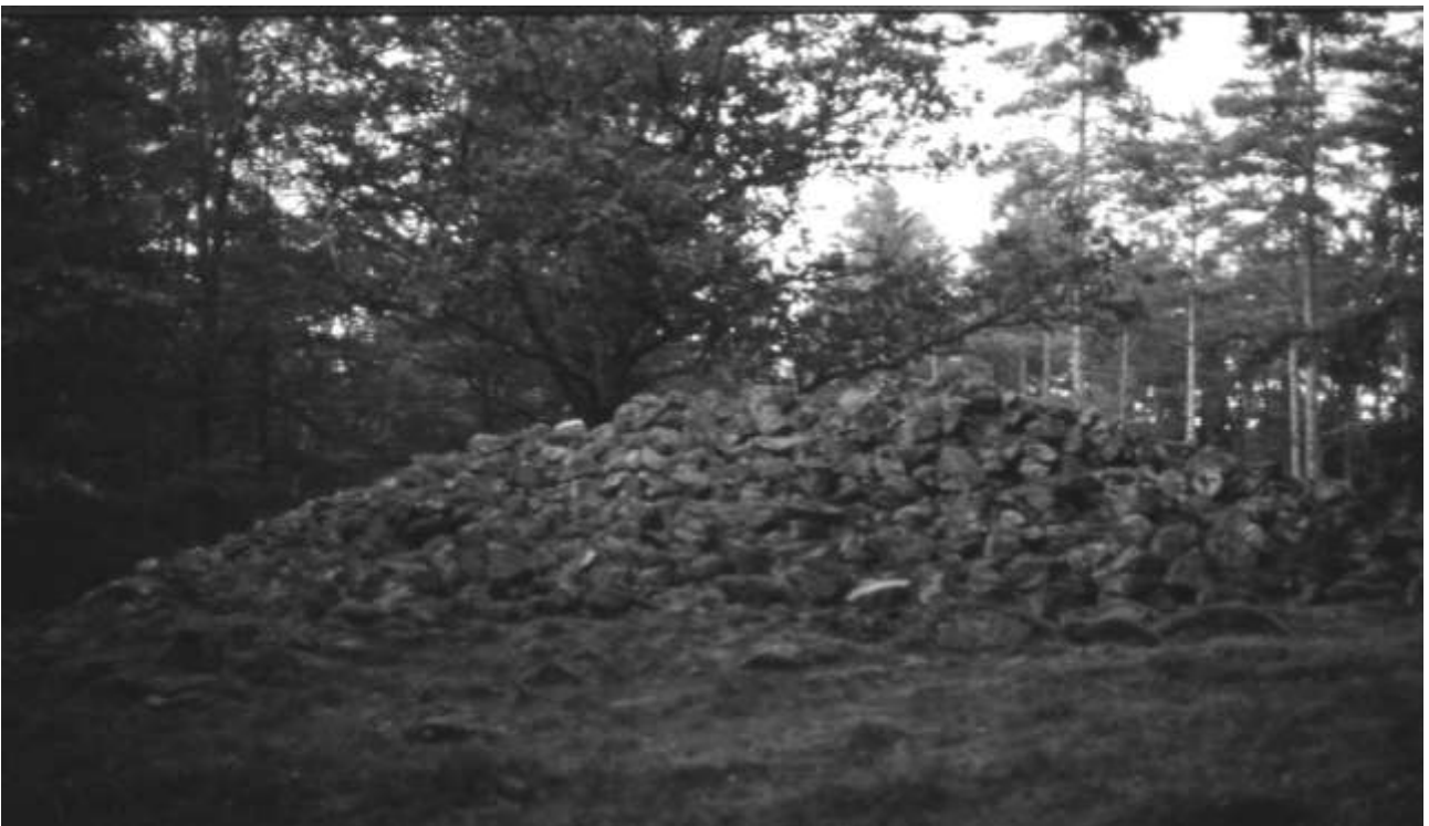
Kratteröset, Ö. Vång

Neolitikum avslutas med den kultur, som avslutar hela stenåldern och anlägger de första synliga fornlämningarna och enda megalitgravarna i Blekinge, nämligen hällkistor, för ett eller vanligare några obrända skelett. De kan ligga i en stensättning, ett röse eller, som i Skåne, i en hög. Keramiken är av mycket dålig kva-