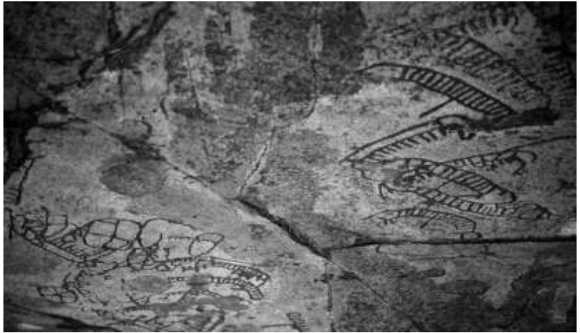
Hästhallen, målade bällristningar

litet. Den s.k. enkla skafthålsyxan är vanlig, och lever vidare in i nästa period, bronsålder. Flintdolken är statusvapen, ytterst vacker, välhuggen och tunn. Vackrare än någon dolk jag sett på museum är den jag fann i en överplöjd gravhög i Skåne under inventering vårvintern 1986, glimmande som en juvel i solen, överst i det sönderplöjda kärnröset. Det fanns en (!) känd förstörd hög när jag kom, jag hittade 70 (!) till. Bland annat p.g.a. de glest spridda gravarna anser man, att bebyggelsen bestått av ensamliggande gårdar. Vid denna tid började boken att bilda skog.