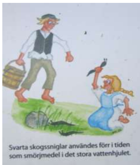
Plansch på anslagstavla vid Pershyttan.

I hjulhuset finns ett stort vattenhjul ett s.k. överfallshjul drygt 11m i diameter. Överfallshjulen är dyra och används när vattentillgången inte är så