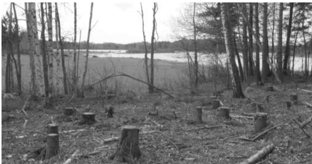
På en udde i Nedre Dalälven har fåbodstället Harvbyvallen legat omgivet av byns älvängar, på ca 20 km:s avstånd från hembyn. Omkring 1880-90 har sista flytten med boskap ägt rum. Ca 120 år senare, 2011, röjde Upplandsstiftelsen både vall och älvängar. I förgrunden ser man stubbarna efter ett, troligen planterat, granbestånd på vallen. Redan 2012 börjar skogsgläntornas blommor att sprida sig vegetativt på detta område, något oväntat, visande nyttan med det återupptagna kobetet. Bredforsens naturreservat.

Älvlandskapet Nedre Dalälven (2011) sträcker sig 170 kilometer längs Dalälvens nedre lopp, från Säter i inlandet ut till havet vid Billudden, och omfattar nio kommuner och delar av