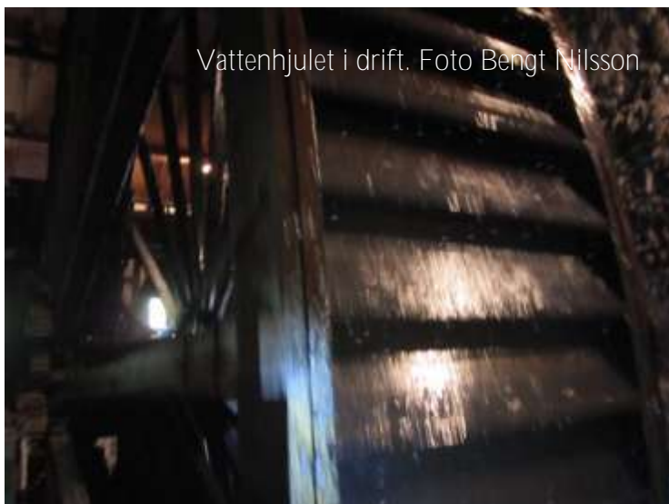
Vattenhjulet i drift.

När vi går runt i grönskan är det svårt att tänka sig hur det såg ut runt Pershyttan för 100 år sedan, ett område med cirka 15km radie utan större träd. Masugnen krävde massor av träkol. Utan träkol inget järn. Träkolet från en mila räckte knappt till ett halvt dygn. Det tog tre veckor att kola en mila. Det måste ha varit