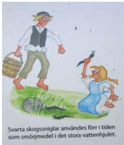
Plansch på anslagstavla vid Pershyttan.

I hjulhuset finns ett stort vattenhjul ett s.k. överfallshjul drygt 11m i diameter. Överfallshjulen är dyra och används när vattentillgången inte är så