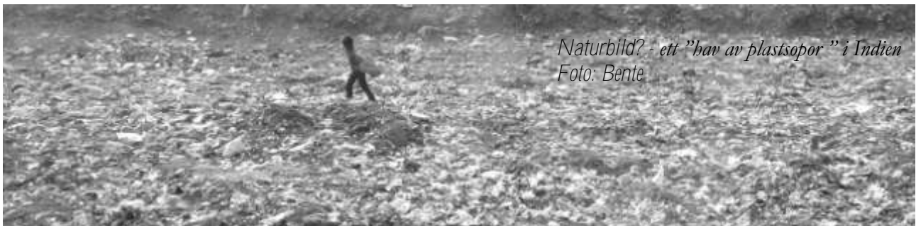
Naturbild? - ett "hav av plastsopor" i Indien

( www.lakareivarlden.org ) som tacksamt tar emot överblivna mediciner för att hjälpa sjuka och fattiga. / Bente