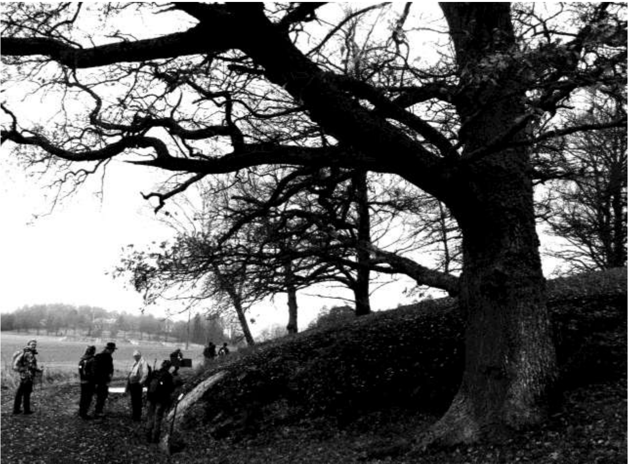
"Åfrid lät efter Svarthövde och efter Igulfast, sina söner och efter Åsgöt" står det ristat på stenhällen vid Edeby.