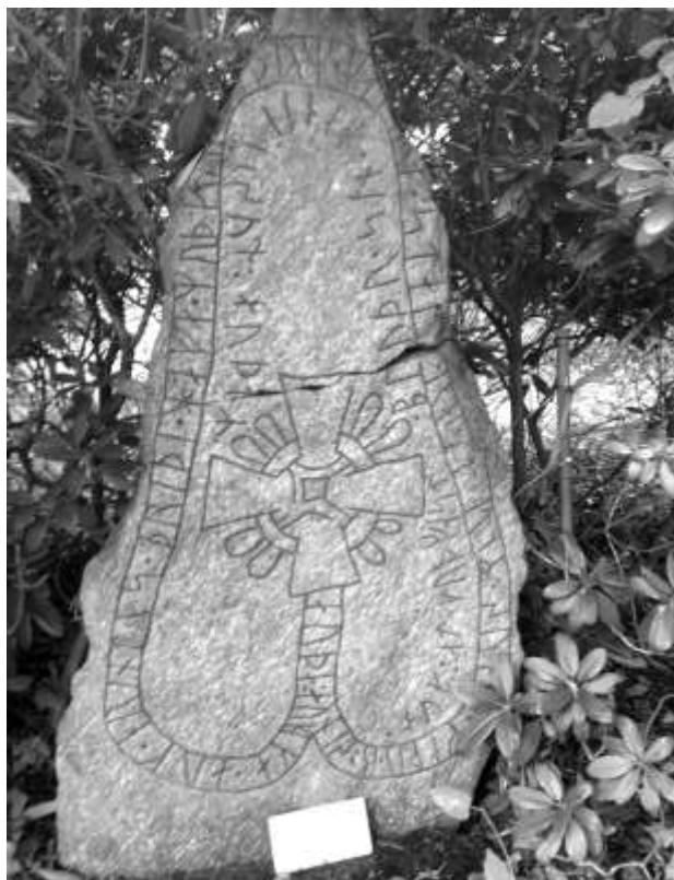
Runstenen vid Husby Gård (Sö 60, i parken bakom gården)