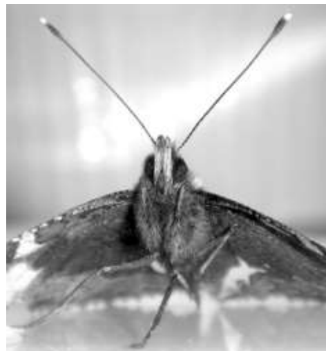
En näselfjäril - kan den ätas?