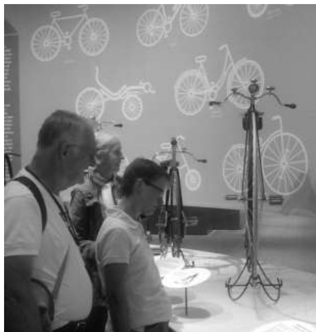
Intresserade FNSiN-besökare på cykelutställningen.