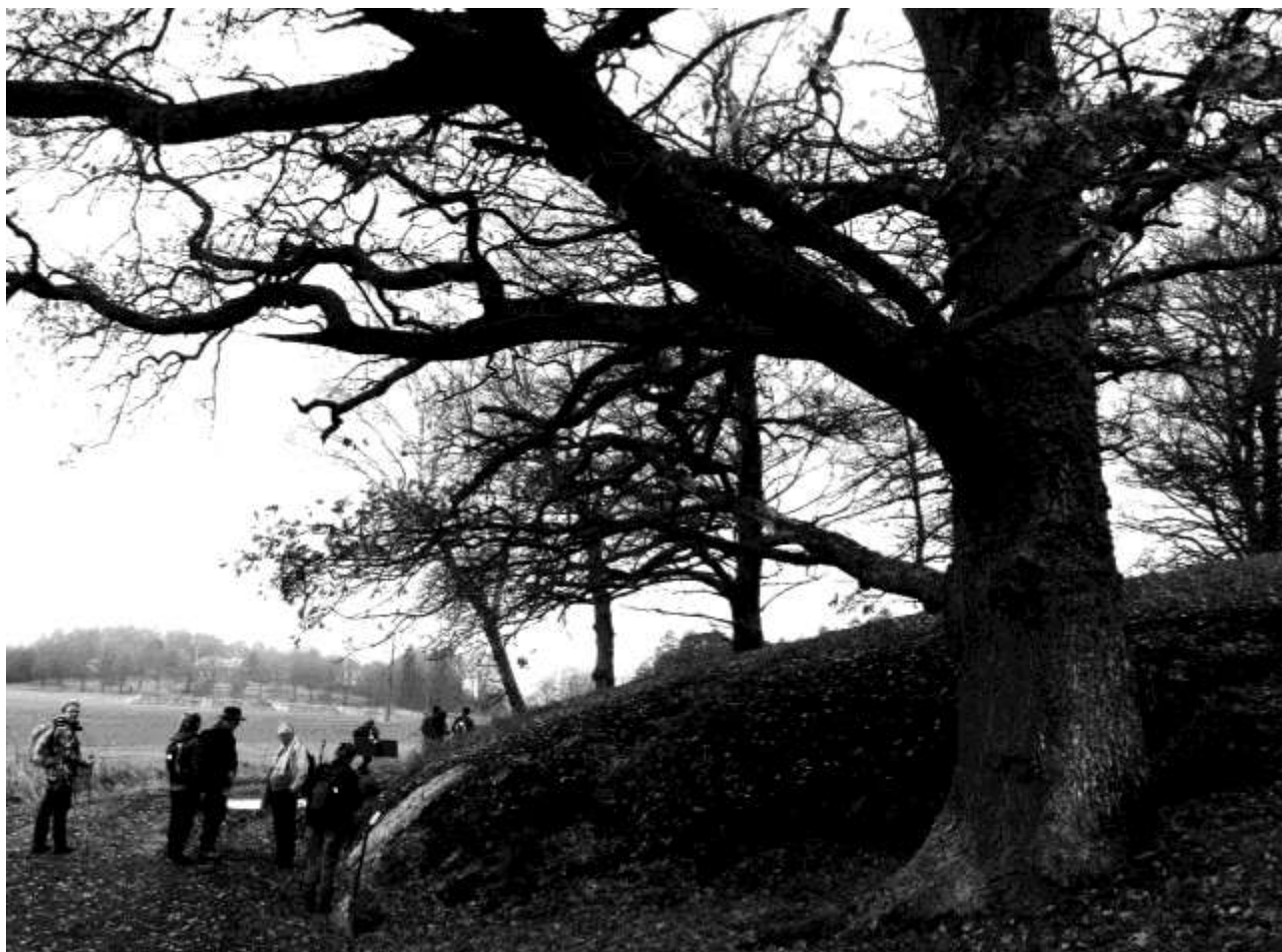
"Åfrid lät efter Svarthövde och efter Igulfast, sina söner och efter Åsgöt" står det ristat på stenhällen vid Edeby.