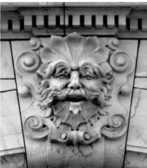
Grön man på Strandvägen