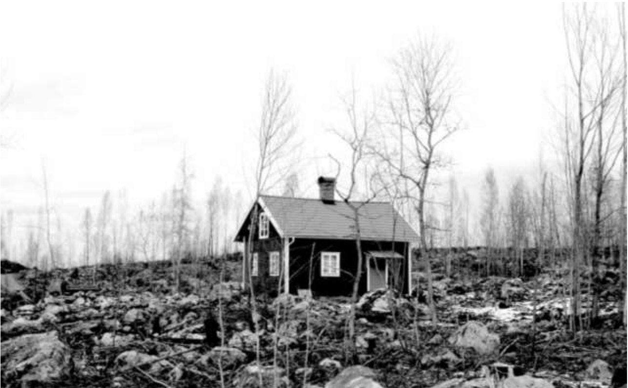
Hus som mirakulöst klarat sig undan branden.