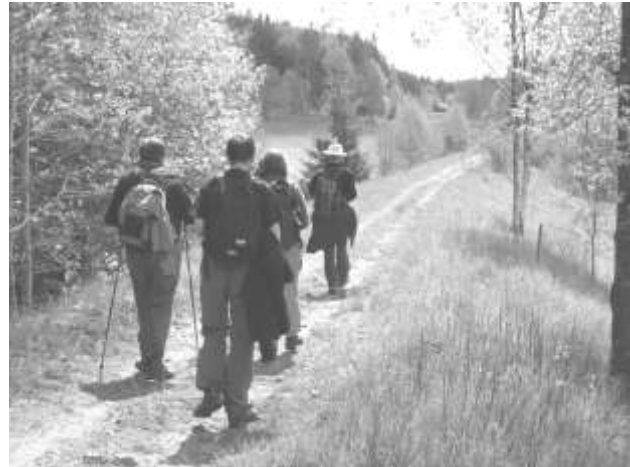
Banvallen syns tydligt och är mycket lätt att gå på.