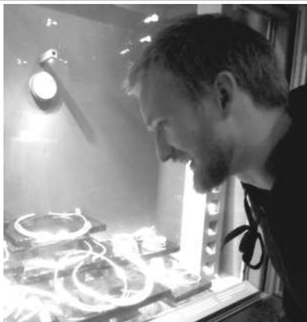
Författaren söker efter TYR bland guldskattna i Guldrummet på Historiska Museet i Stockholm

Tyr har sannolikt getts olika funktioner och karaktärsdrag i olika kontexter och tider. Man kan ändå se ett par betydelsefulla drag i föreställningarna kring Tyr; det ena är det etymologiska ursprunget i en himmelsgud, det andra är (den enda väl belagda) funktionen som krigsgud. Det indoeuropeiska komparativa materialet ger vid handen att en himmelsgudsfunktion synes vara mycket ålderdomlig och arkaisk i sammanhanget, samtidigt som de gemensamma krigiska dragen som Tyr delar med kontinental-germanska