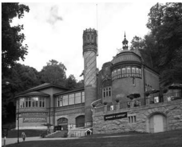
Skånska gruvan på Djurgården.

Som konstnärinna måste Kerstin von Post ha varit framgångsrik för hon kunde köpa ut sina syskon från barnhemmet för 600.000 kr. Mindre framgångsrik blev hennes affärsverksamhet. Hon gjorde ett försök att odla vindruvor i Sörmland och 1875 övertog hon koncessionen att bedriva gruvsdrift på Färöarna. Gruvan ligger på den sydligaste av öarna, Suðuroy, och där hade gruvsdrift