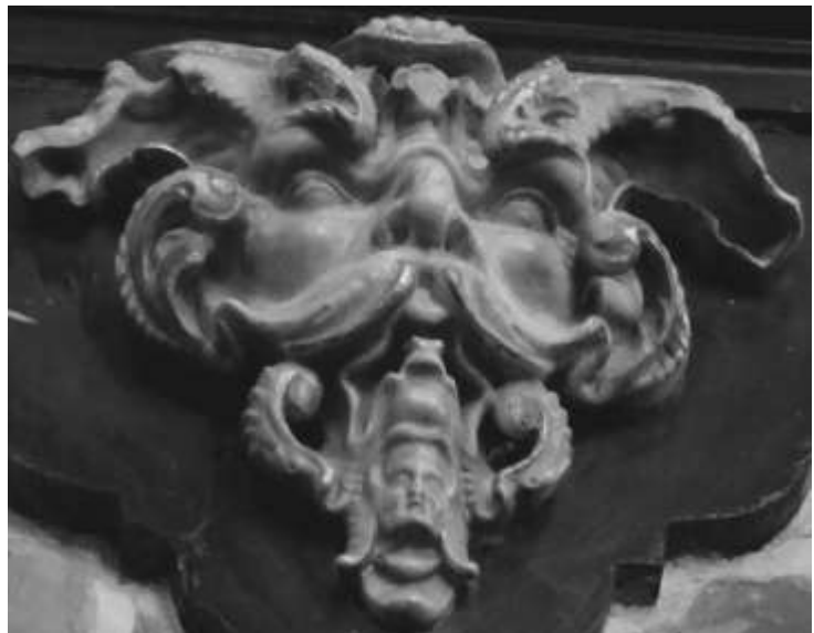
Grön man i Storkyrkan