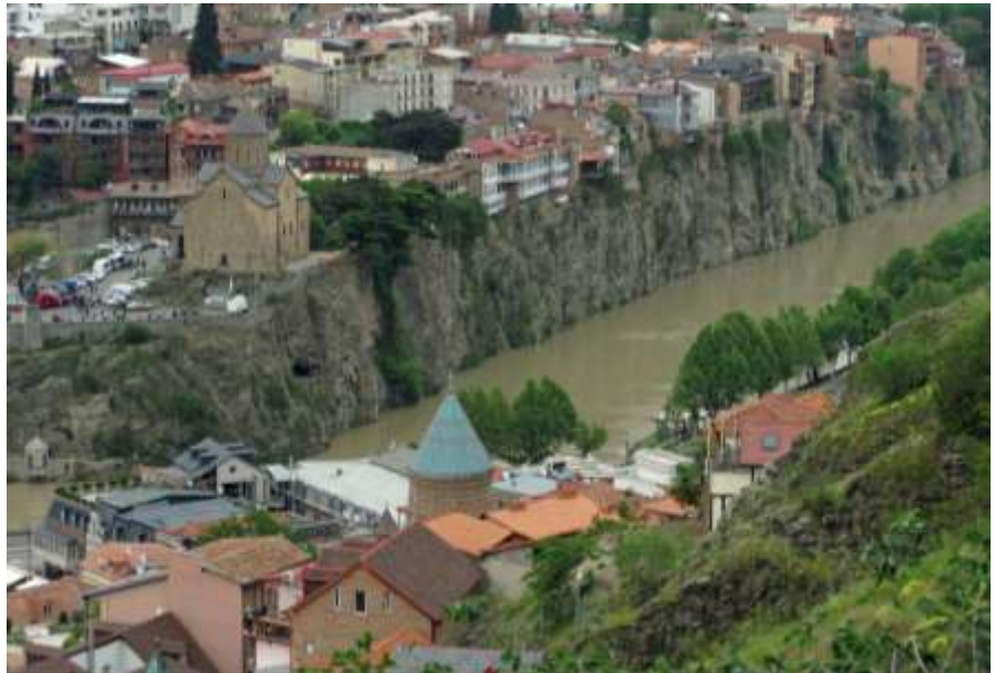
Floden Kura inne i dagens Tbilisi.

Det är faktiskt så, att det citatet vi söker fortfarande är lite osäkert att tolka. Å andra sidan är detta det enda vi har. Visserligen finns ett större antal varjager nämnda och de kunde tyda på väringagardet i Konstantinopel, där genom åren tusentals nordbor tjänstgjort. Men med kännedom om att rebellen Liparit stöddes av Bysans och att kungen fick stöd av de nämnda varjagerna verkar det troligt att de identifierades som var-