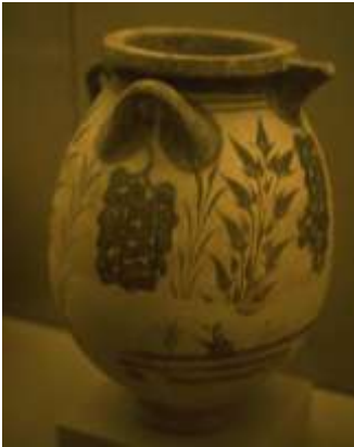
Kruka med vindruvsmotiv.

Växter av alla slag avbildas, som palmer, enstaka stora lövträd och olika blommor, t ex liljor, krokus, papyrus, samt vass och gräs. Både djur och växter är lätta att artbestämma. Rosetter, spiraler, geometriska motiv och abstrakta mönster verkar vara vanligare på äldre målningar. De hittas ibland bakom senare fresker. Typiska landskap som berg och klippor, havs- och flodstränder är populära motiv.