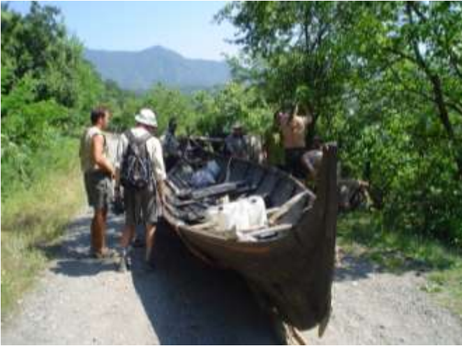
Expeditionens båt Himingläva under färd över en dragsträcka efter dragdjur.