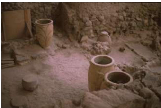
Hus med pithoikrutor

får man gå precis där stadsborna en gång gick, men man får inte hälsa på inomhus. I områdets övriga delar går man på uppbyggda trågångar något över gatunivå, och ser ner i de raserade, öppna husen, vilka innehåller alla slags hushållsföremål, så som de kvarlämnades i flykten. Främst de stora pithoiktunnorna i keramik, ofta med mönster. Nästan varje hus har en inbyggd bänk med en handkvarn. Överallt finns hundratals vävtyngder. Man har även funnit lerfragment med Linear A-skrift, ett av de båda