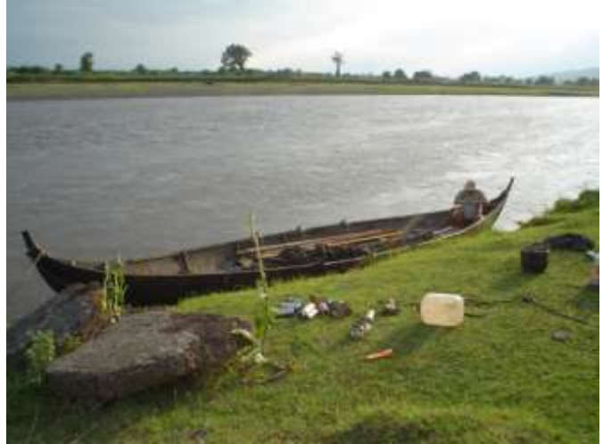
Båten Himingläva förtöjd vid floden Rioni.