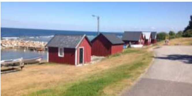
Bodar i Halls fiskeläge.