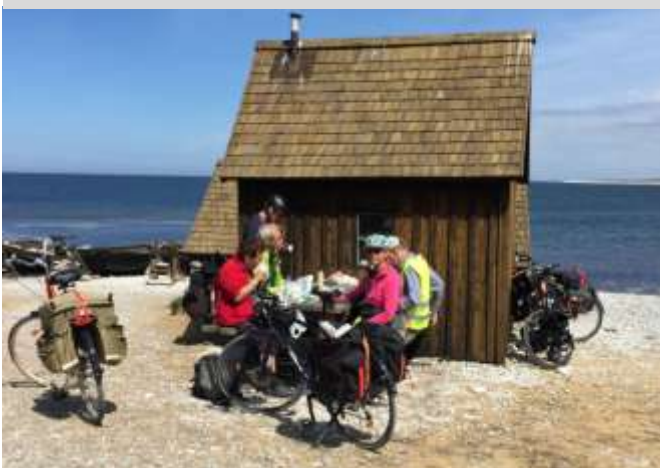
Matras vid Helgumannen, Fårö.