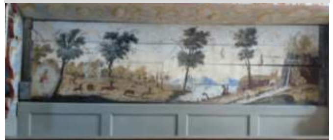
Målning med enhörning i Tingstäde kyrka