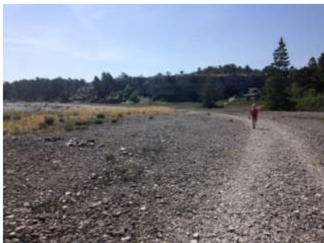
Ön Furillen, stranden vid Östervik.