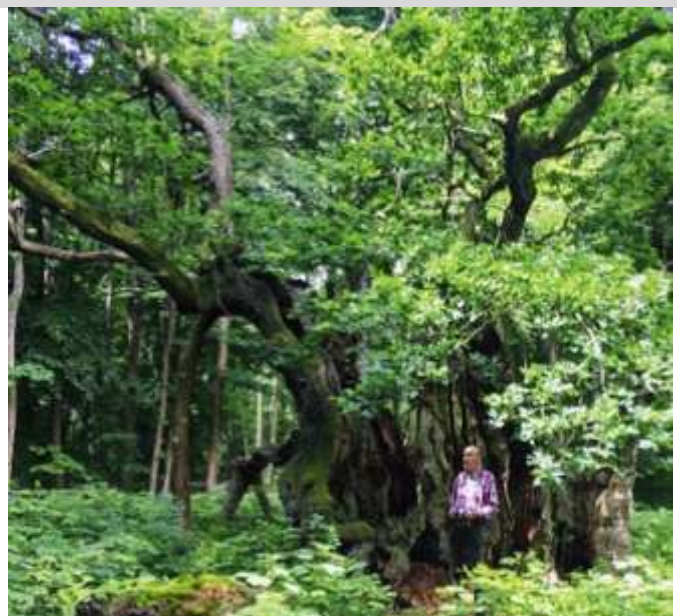
Författaren framför Kongeegen

Några hundra meter innanför stranden finns tre ekar, sedan sekler mycket kända. De är från nordväst mot sydöst Storkeegen, Kongeegen och Snoegen. Jag har både gått och cyklat i skogen för länge sedan. Förra sommaren, 2017, gjorde min sys-