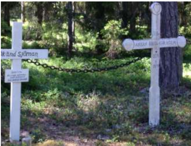
Åländskt kors med rundlar på armarna.