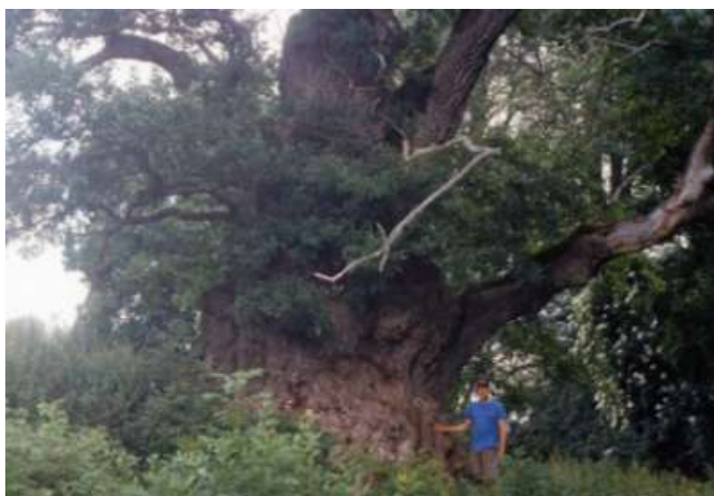
Trädgårdsmästaren bredvid Nynäseken.

Man kan jämföra Kongeegen med stora ekar i övriga Europa, varav 11 enligt litteratur är 10 – 13,5 m i omkrets. I Sverige är den största eken i Kvill i Småland 12,75 m i omkrets och ca 1000 år gammal. Vid en nyligen genomförd trädinventering i hela Stockholms län, blev den största eken ett levande träd på gårdsplanen till Nynäs gård i Nynäshamn. Den är 10,6 m i omkrets, och troligen med en ålder av ca 700 år. Jag har besökt trädet med tillstånd av gårdens trädgårdsmästare.