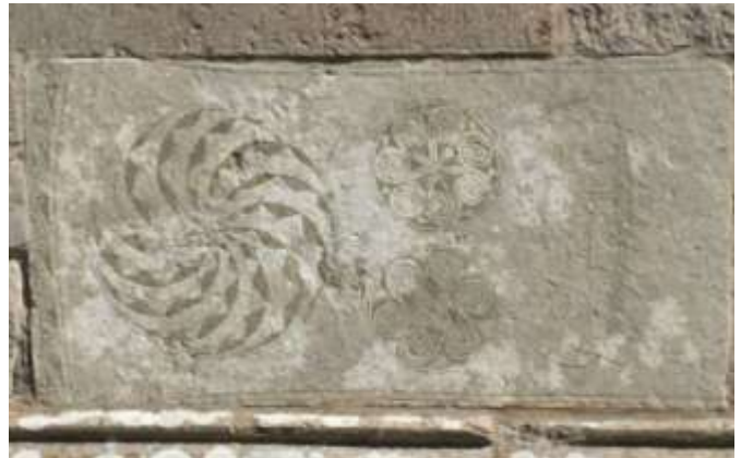
Bildstenen från 400-talet i väggen, Bro kyrka.

Tingstäde kyrka i tornkammaren finns dopfunten som är från 1100-talet och de avnötta sandstensreliëferna har avbildat Jesu födelsehistoria. På insidan till vänster av tornkammaren en bit upp på väggen finns en mönstrad bit av en gammal bildsten från 400-talet.